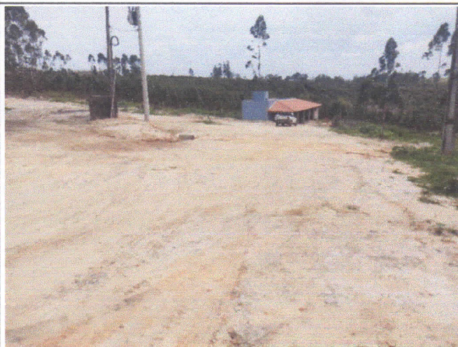
Presença de rede de distribuição de energia elétrica ao longo da via.