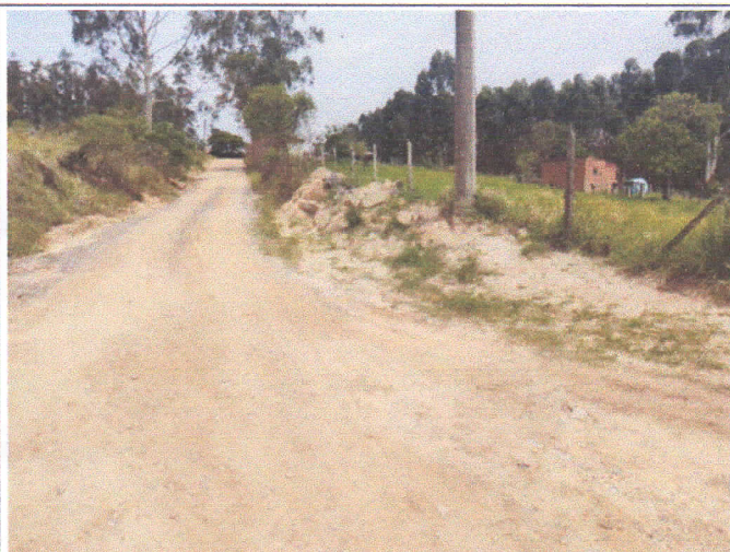
Lado esquerdo da Rua Cláudio Rogério do Nascimento em relação ao início da via.