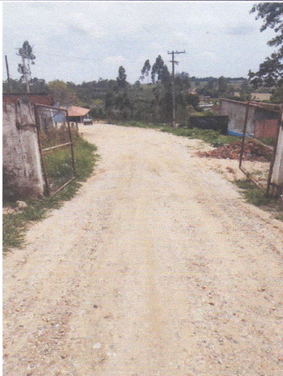
Continuação da via.