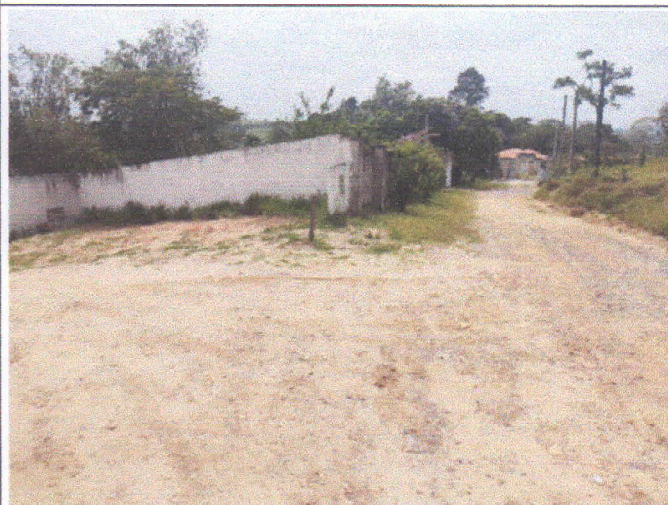
Lado direito da Rua Cláudio Rogério do Nascimento em relação ao início da via.