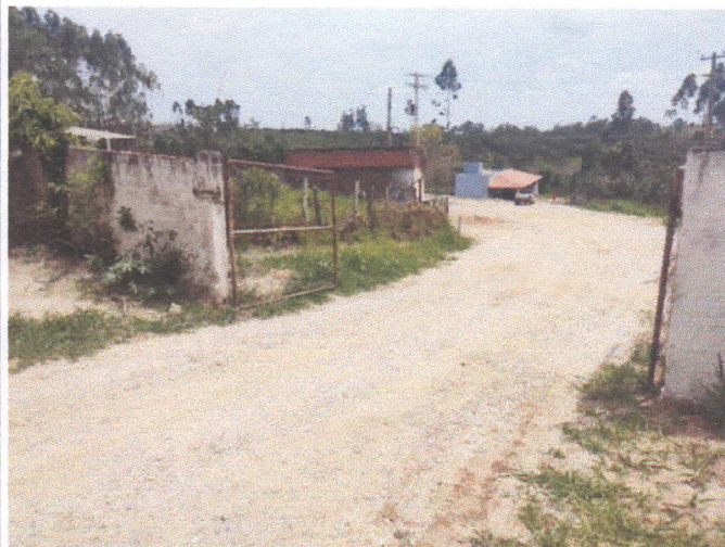
Presença de muros e demais elementos de delimitação.