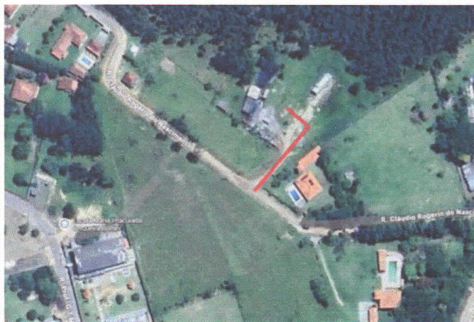
Localização: Perímetro Urbano, Sarapu - SP, 18225-000 - Coordenadas: -23.624573, -47.822468.