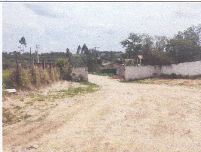
Início da via vistoriada.